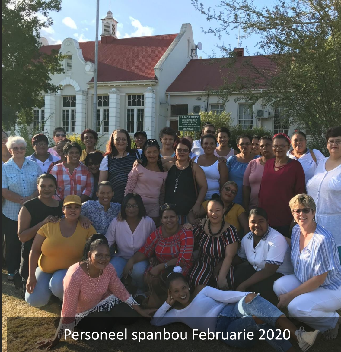
Personeel spanbou Februarie 2020